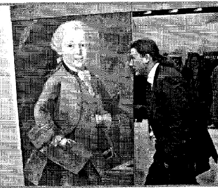
Το Έτος Μότσαρτ γιορτάζεται με πλήθος εκθέσεων ανά τον κόσμο

■ Ο ΑΥΣΤΡΙΑΚΟΣ συνθέτης Βόλφγκανγκ Αμαντέους Μότσαρτ (1756-1791) υπήρξε από τις μεγαλύτερες μουσικές ιδιοφυΐες όλων των εποχών. Γεννήθηκε στο Σάλτσμπουργκ και ήταν γιος του βιολιστή Λέοπολντ Μότσαρτ. Το ταλέντο του εκδηλώθηκε από την παιδική του ηλικία. Στα έξι του χρόνια συνέθεσε τα πρώτα έργα του. Υπήρξε πρώτος βιολιστής σε μεγάλες ορχήστρες. Το πλούσιο έργο του περιλαμβάνει κονσέρτα για βιολί, κονσέρτα για πιάνο, σερβάντες, συμφωνίες, εκκλησιαστική μουσική, όπερες κ.λπ. Περιφημες όπερες του Μότσαρτ που ξεχώρισαν και αγαπήθηκαν από το κοινό είναι «Η απαγωγή από το Σεράι», «Ο Μαγικός Αυλός», «Οι γάμοι του Φίγκαρο», ο «Ντον Τζιοβάνι» και το «Ετσι κάνουν όλες». Πέθανε πάμπρωτος, σε ηλικία 35 χρόνων. Λίγο πριν από το θάνατό του ολοκλήρωσε το περίφημο «Ρέκβιεμ», που αποτελεί σύνθεση νεκρώσιμης ακολουθίας.