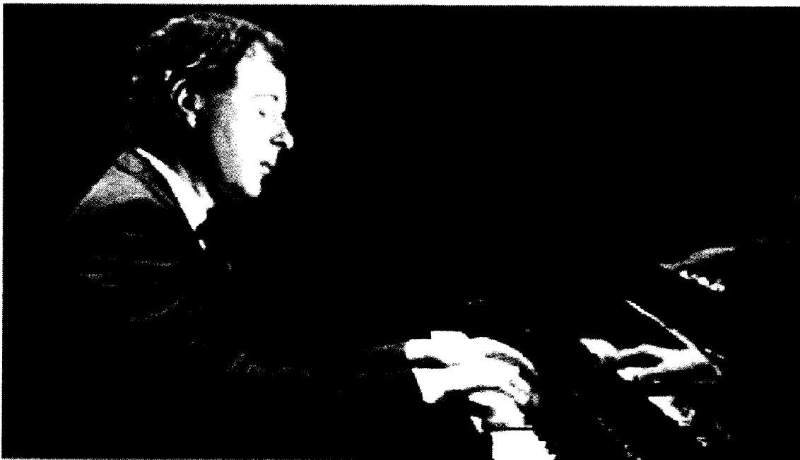
Ο πιανίστας Andras Schiff

μασμένη εμπειρία και βαθιά κατανόηση του ζητούμενων αντιμετώπισε τον ερμηνευτικά εύφορο κόσμο του Liszt αναδεικνύοντας πρωτοτυπία σκέψης, τη λαμπρή και ενίοτε τολμηρή αρμονική γραφή, τις μεταμορφώσεις των θεμάτων και γενικότερα την άρτια επεξεργασία του μουσικού υλικού. Συνοψίζοντας, το εκλεπτυσμένο και αριστοκρατικό παίξιμο του Ciccolini αποτέλεσε μοναδικό μάθημα μουσικής και πιανιστικής λογικής, καλού γούστου, σαφήνειας και καλλιτεχνικής γενναιοδωρίας. Εκτός προγράμματος ακούστηκαν δύο χοροί: ένα σύντομο Βαλς για πιάνο του Franz Schubert και στη συνέχεια «Ο Χορός της Φωτιάς», από το Μπαλέτο Ο Μάγος Έρωτας του Manuel De Falla (με πόση φλόγα και ταμπεραμέντο ερμηνεύτηκε το τελευταίο!). Περιμένουμε την επόμενη ελληνική εμφάνιση του πιανίστα που θα λάβει χώρα στο Μέγαρο Μουσικής Θεσσαλονίκης. Στις 12/5, συμπράττοντας με την Κρατική Ορχήστρα Θεσσαλονίκης, ο Ciccolini θα ερμηνεύσει το σολιστικό μέρος του