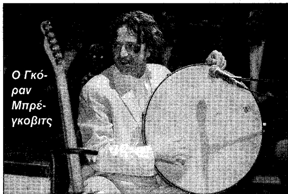
Ο Γκόραν Μπρέγκοβιτς

Επίσης, στις άλλες εκδηλώσεις, θα γίνουν συναυλίες του Γιάννη Μαρκόπουλου τον Ιανουάριο του 2007, ο Γιώργος Νταλάρας θα παρουσιάσει την «Ιστορία του ρεμπέτικου» τον Μάιο του '07, σε καλλιτεχνική επιμέλεια της Άννας Νταλάρα, ο Γκόραν Μπρέ-