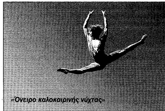
«Όνειρο καλοκαιρινής νύχτας»