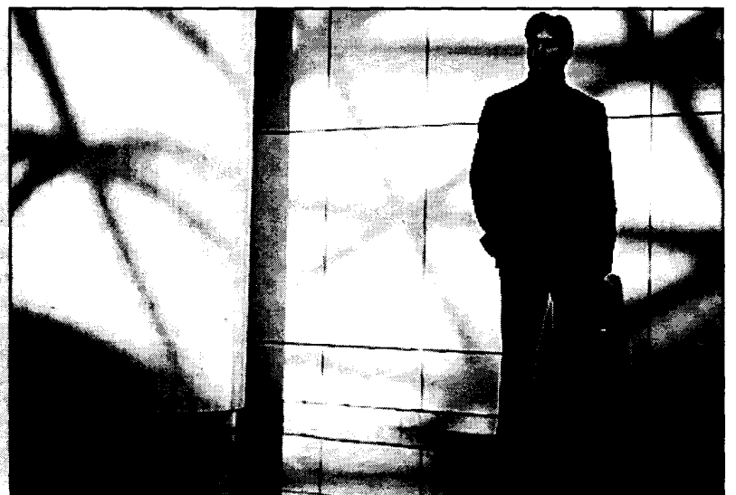
Συναυλία στη Θεσσαλονίκη θα δώσει και η Συμφωνική Ορχήστρα Ραδιοφωνίας της Στουτγάρδης, με σολίστ τον Λεωνίδα Καβάκο