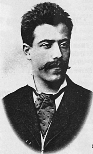
Gustav Mahler, 1883

ΤΡΑΓΟΥΔΙΑ ΕΝΟΣ ΟΔΟΙΠΟΡΟΥ ΓΙΑ ΦΩΝΗ ΚΑΙ ΟΡΧΗΣΤΡΑ