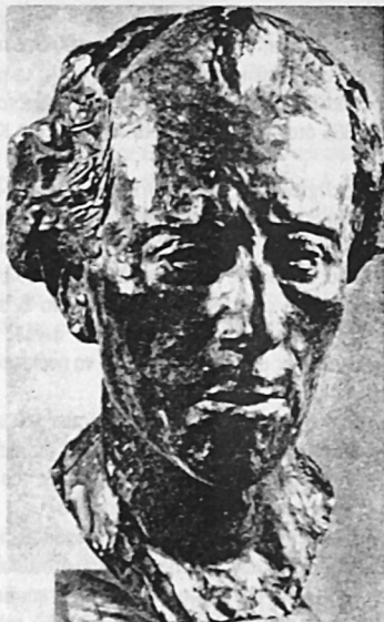
Gustav Mahler. Γλυτό από τον Auguste Rodin

Η μανία του φινάλε ( Stürmisch bewegt ) η οποία ακολουθεί αμέσως το πένθιμο εμβατήριο, διακόπτει την ηρεμία και την ψυχική ανάταση σαν μία ξαφνική καλοκαιρινή καταιγίδα.