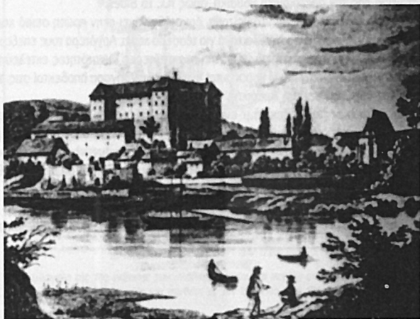
Άποψη του κάστρου και της εκκλησίας του χωριού Nelahozeves, κοντά στον ποταμό Vltava, όπου γεννήθηκε ο Dvorak