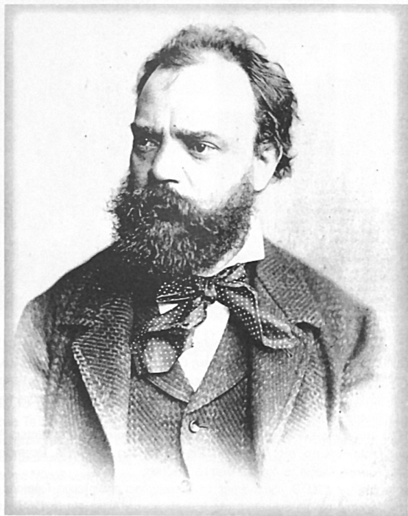
ANTONIN DVORAK (1841-1904)