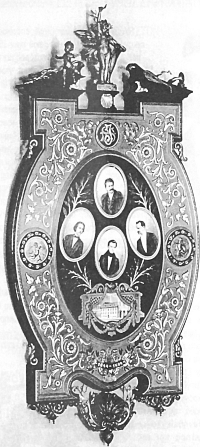
Η δυναστεία των Strauss. Απεικονίζονται ο πατέρας Strauss και οι τρεις από τους γιους του.