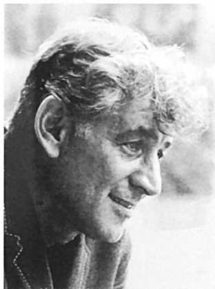
Leonard Bernstein (1918-1990)

Η Candide , το τρίτο έργο που συνέθεσε ο L. Bernstein για τη σκηνή του Μπρόντγουαι, είναι μια κωμική οπερέτα βασισμένη στην ομώνυμη σάτιρα του Βολταίρου. Το λιμπρέτο οφείλεται στη Lillian Hellman και οι στίχοι στους Richard Wilbur, John Latouche και Dorothy Parker. Η πρώτη παράσταση του έργου δόθηκε στο θέατρο Martin Beck της Νέας Υόρκης την 1η Δεκεμβρίου 1956.