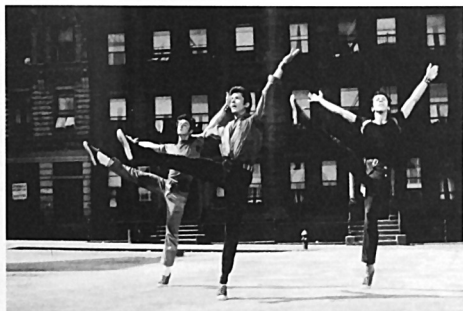
Σκηνή από την κινηματογράφηση του μιούζικαλ