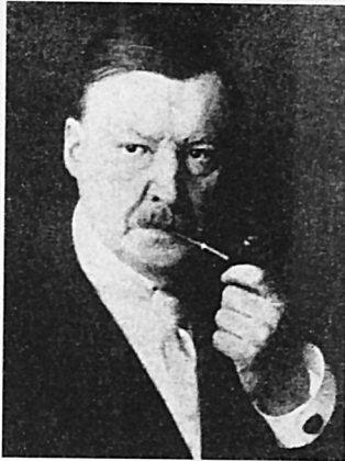
Alexandre Glazounov (1865-1936)

ΚΟΝΤΣΕΡΤΟ ΓΙΑ ΒΙΟΛΙ ΚΑΙ ΟΡΧΗΣΤΡΑ ΣΕ ΛΑ ΕΛΑΣ., ΟΡΥΣ 62