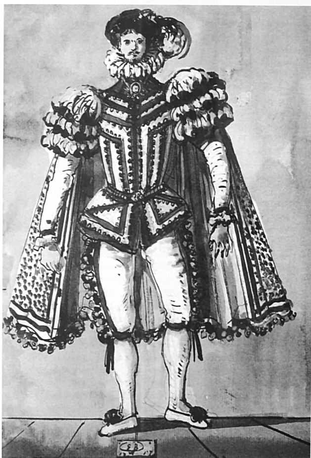
Don Giovanni - (1957). Costume design for Don Giovanni by Eugene Berman