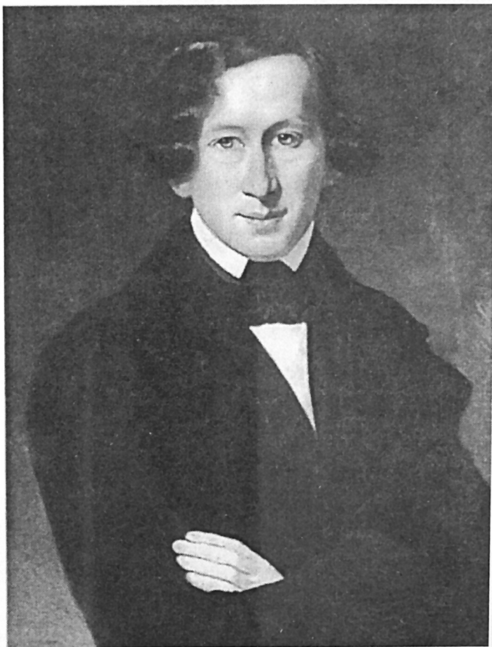
Ο Hector Berlioz όταν τιμήθηκε με το «Βραβείο της Ρώμης». Πορτραίτο από τον Claude-Marie Dubufe. (Conservatoire national supérieur de Musique, Paris)