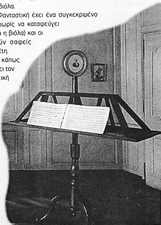
Το διπλό αναλόγιο από Mahagoni του νεαρού μουσικού.

Μια ομάδα από προσκυνητές που «ψάλλουν τη βραδυνή τους προσευχή» συναντά ο Χάρολντ στη δεύτερη κίνηση ( allegretto ). Αργά από μακριά πλησιάζει στο τραγούδι των προσκυνητών, μια θρησκευτική