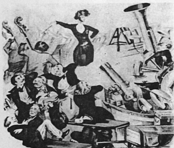
Οι τεράστιες ορχήστρες του Μπερλιόζ αποτελούσαν αγαπημένο θέμα των γελοιογράφων της εποχής.