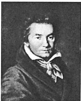
Ο Beethoven σε ηλικία 45 ετών

Ο Μπετόβεν έγραψε την Όγδοη Συμφωνία του στο Τέπλιτς, τέσσερις μόλις μήνες μετά την Έβδομη , στα 1812, τη χρονιά της μεγάλης εκστρατείας του Ναπολέοντα στη Ρωσία. Το έργο δόθηκε σε πρώτη εκτέλεση στη Βιέννη στις 27 Φεβρουαρίου του 1814 και εκδόθηκε αργότερα από τον οίκο Στάινερ της Βιέννης με τον τίτλο Όγδοη Μεγάλη Συμφωνία σε φα μείζονα .