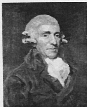
J. Haydn, Πορτραίτο από τον John Hoppner, London 1791

Η αυθεντικότητα του ωραίου αυτού κοντσέρτου αμφισβητήθηκε κάποτε από μερικούς μουσικολόγους (κυρίως τον Φόλκμαν), που ζήτησαν να το αποδώσουν στο μαθητή του Χάυρν, Άντον Κραφτ. Σήμερα, χάρη στις έρευνες ιδιαίτερα του Δανού μουσικολόγου Λάρσεν (με το ογκώδες βιβλίο του για τον Χάυρν το 1939), τα πράγματα έχουν αποκατασταθεί και το κοντσέρτο, που έχει την αδιάψευστη σφραγίδα του ύφους του Χάυρν, ξαναπήρε την οριστική του θέση στον κατάλογο των έργων του μεγάλου συνθέτη.