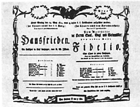
Από την τρίτη παρουσίαση του Φιντέλιο, 1814

Καθώς είναι γνωστό, ο Μπετόβεν έγραψε για τη όπερά του Φιντέλιο τέσσερις εισαγωγές, τρεις με τον τίτλο Λεωνώρα και μία με τον τίτλο Φιντέλιο . Οι εισαγωγές με τον τίτλο Λεωνώρα δεν αριθμούνται με τη σειρά δημιουργίας τους. Στην πρώτη παράσταση της όπερας το 1805 υπό τη διεύθυνση του συνθέτη παίχθηκε η Λεωνώρα αρ. 2 , έργο 72α. Στην επανάληψη της όπερας, διασκευασμένης από το φίλο του μεγάλου συνθέτη Στέφανο Μπρωίνινγκ σε δύο πράξεις (αντί τρεις), ο Μπετόβεν έγραψε στα 1806 την αριστουργηματική Λεωνώρα αρ. 3 , έργο 72 β. Στα 1870 έγραψε, για ένα σχεδιαζόμενο