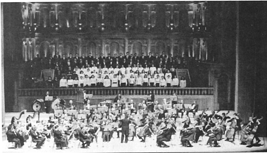
Η Κ.Ο.Θ. στη γιορτή εγκαινίων του Μεγάρου Μουσικής Θεσσαλονίκης, Κυριακή 2 Ιανουαρίου 2000 (Τα Νικητήρια, Δ' μέρος από τη Συμφωνία της Λεβεντιάς του Μανώλη Καλομοίρη)

Η Κρατική Ορχήστρα Θεσσαλονίκης ιδρύθηκε το 1959 ως τμήμα του Κρατικού Ωδείου Θεσσαλονίκης με τον αρχικό τίτλο 'Συμφωνική Ορχήστρα Βορείου Ελλάδος' (Σ.Ο.Β.Ε.).