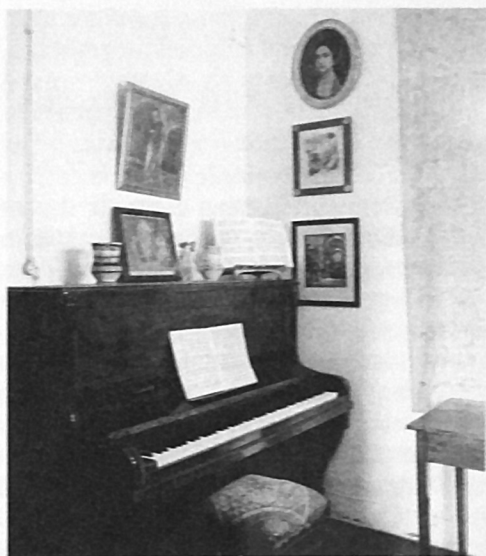
Το όρθιο πιάνο του de Falla από το σπίτι του στη Γρανάδα.

Ανατολίτικα - μυστικιστικά στοιχεία του κυρίου θέματος στα κόρνα, τα οποία ενισχύονται από τη διατονική αρμονία της συνοδείας, δημιουργούν την ανάλογη ατμόσφαιρα.