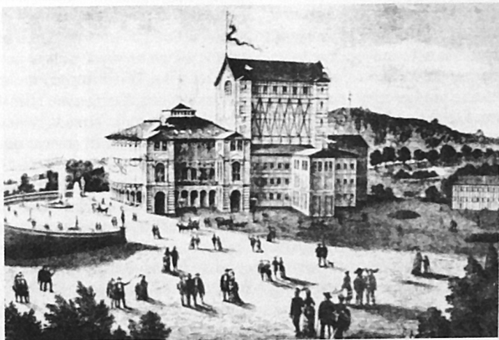
Το θέατρο Festspielhaus του Μνάρουτ το 1876.