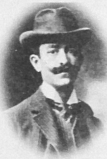
M. de Falla

«ΜΑΓΙΚΗ ΑΓΑΠΗ», ΣΟΥΪΤΑ ΜΠΑΛΕΤΟΥ ΓΙΑ ΤΡΑΓΟΥΔΙ ΚΑΙ ΟΡΧΗΣΤΡΑ.