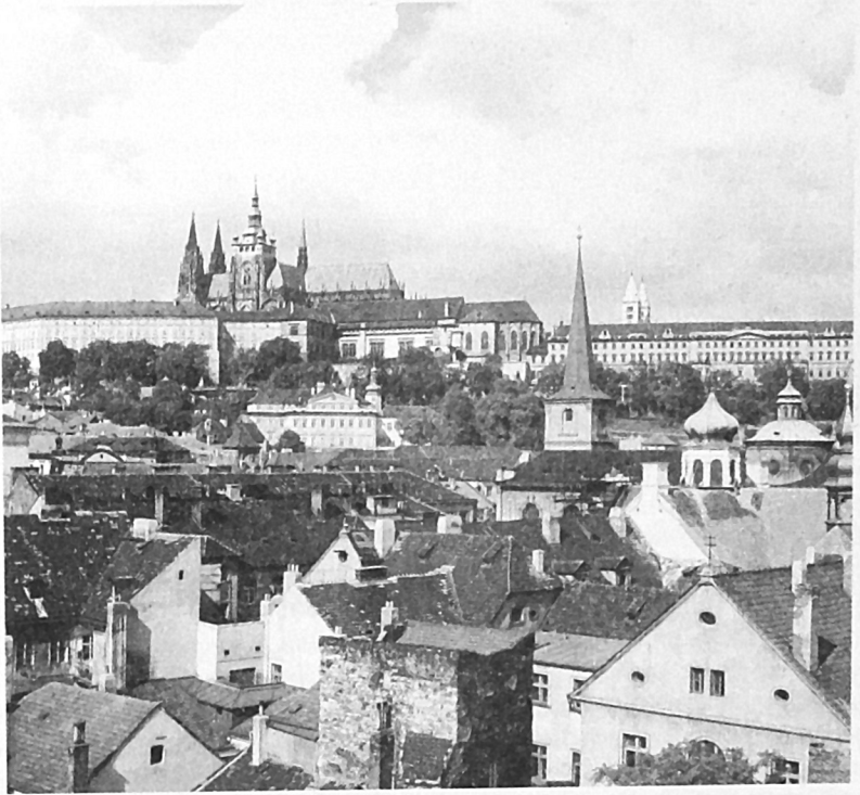
Η Πράγα στην εποχή του Dvorak.