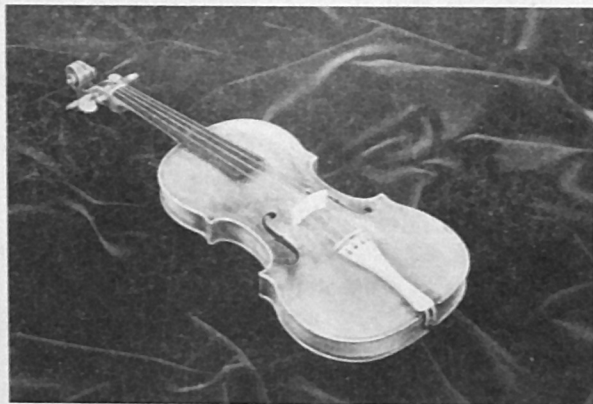
Το βιολί του συνθέτη στο Μουσείο Mozart της γενέτειράς του.