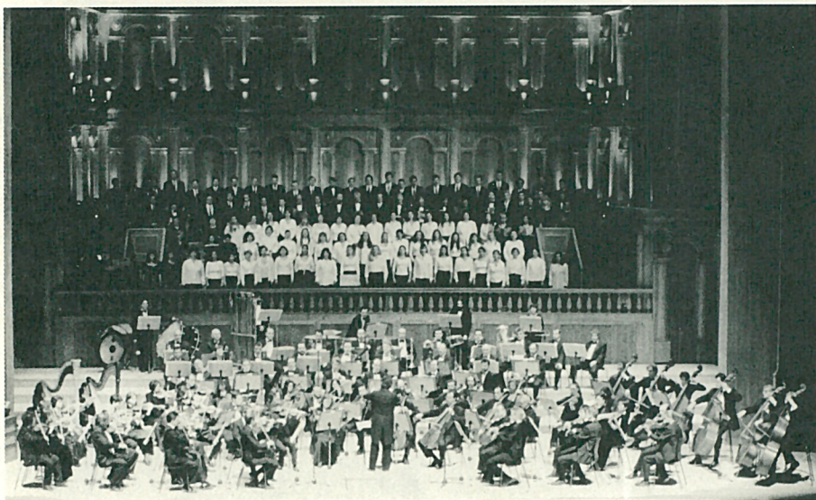
Η Κ.Ο.Θ. στη γιορτή εγκαινίων του Μεγάρου Μουσικής Θεσσαλονίκης, Κυριακή 2 Ιανουαρίου 2000 (Τα Νικητήρια, Δ' μέρος από τη Συμφωνία της Λεβεντιάς του Μανώλη Καλομοίρη)

Η Κρατική Ορχήστρα Θεσσαλονίκης ιδρύθηκε το 1959 ως τμήμα του Κρατικού Ωδείου Θεσσαλονίκης με τον αρχικό τίτλο 'Συμφωνική Ορχήστρα Βορείου Ελλάδος' (Σ.Ο.Β.Ε.).