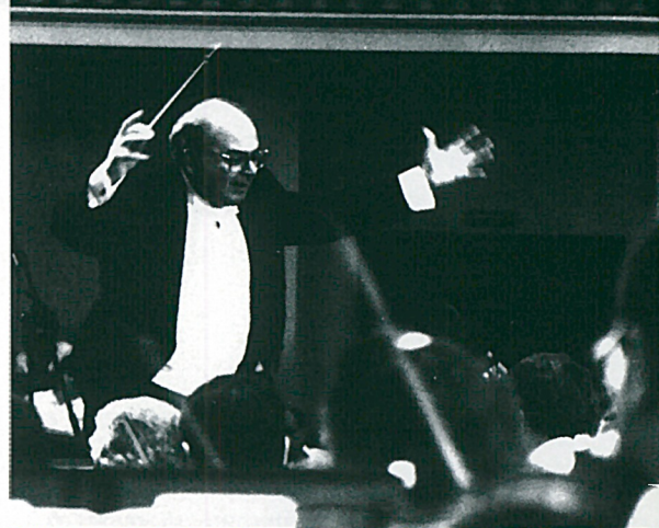
Διευθύνοντας τη Φιλαρμονική Ορχήστρα της Αρμενίας στο Γερεβάν (1994)