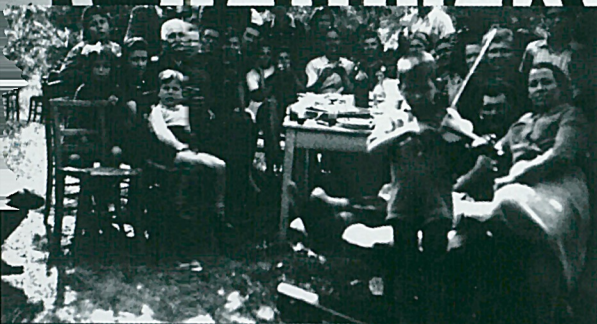
Σε ηλικία πέντε ετών (1941)