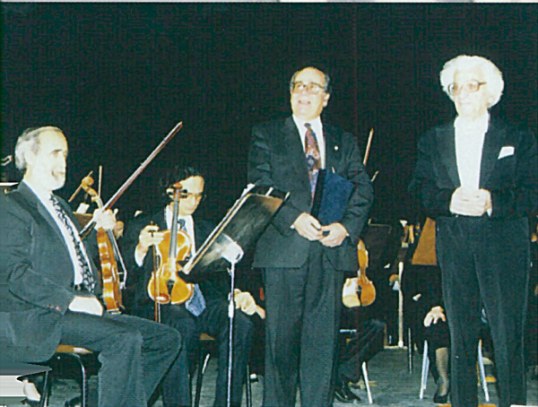
Ως Διευθυντής της Κ.Ο.Θ. σε συναυλία - αφιέρωμα στον Οδ. Δημητριάδη (1993)

▲ Η Ορχήστρα αυτή αναδείχθηκε σύντομα όχι μόνο σε ένα νέο δυναμικό μουσικό σύνολο, αλλά και σε φυτώριο πολλών νέων καλλιτεχνών. Ο ίδιος άλλωστε διηύθυνε τη Συμφωνική Ορχήστρα του Δήμου Θεσσαλονίκης σε περισσότερες από 120 συναυλίες, τόσο στην Ελλάδα όσο και το εξωτερικό.