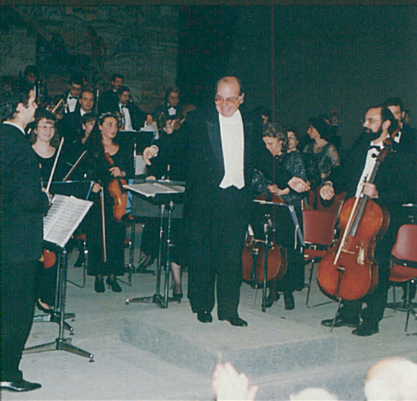
Διευθυντής της Δημοτικής Ορχήστρας Θεσσαλονίκης (1992)