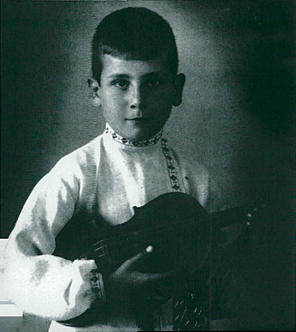
Το πρώτο του ρεσιτάλ σε ηλικία επτά ετών (1943)

Η Θεσσαλονίκη ανέδειξε αρκετούς μουσικούς που τίμησαν και τιμούν την πόλη μας στην Ελλάδα και το εξωτερικό. Σπάνιες όμως είναι οι περιπτώσεις με την ποικιλία και την έκταση των επιδόσεων του Κοσμά Γαλιλαία: ταλαντούχος μουσικός (ως σολίστ, εξάρχων βιολιστής και αρχιμουσικός), εμπνευσμένος δάσκαλος, έμπειρος οργανωτής μουσικών σεμιναρίων και ωδείων, ιδρυτής μουσικών συνόλων και εμψυχωτής ποικίλων καλλιτεχνικών δραστηριοτήτων.