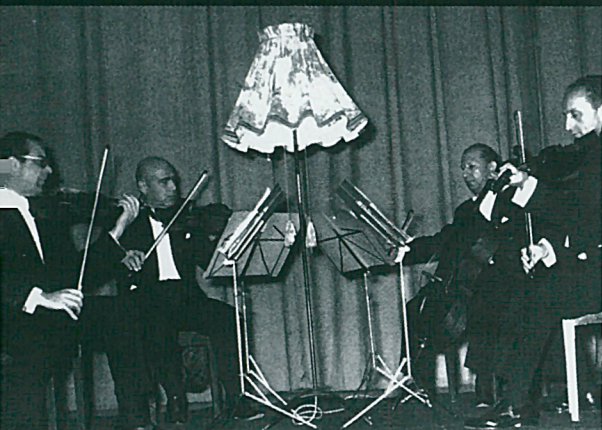
Κουαρτέτο Β. Ελλάδος (1965)