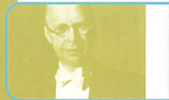
Sergei Prokofiev (1891 - 1953)