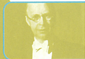
Sergei Prokofiev (1891 - 1953)