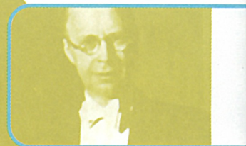
Sergei Prokofiev (1891 - 1953)