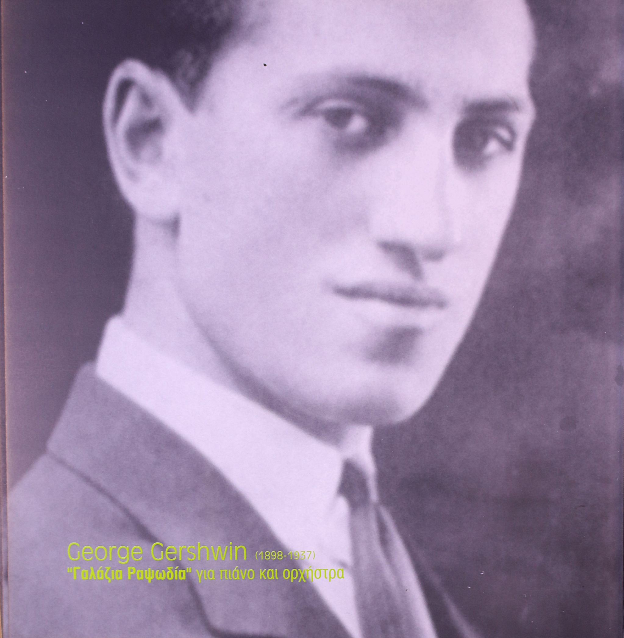
George Gershwin (1898-1937) "Γαλάζια Ραψωδία" για πιάνο και ορχήστρα