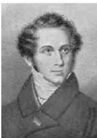
VINCENZO BELLINI (1801-1835)

Τον 19ο αιώνα στην Ιταλία η μουσική εξελίσσεται κυρίως μέσα από την όπερα και μάλιστα μέσα από τις όπερες τεσσάρων συνθετών: στην αρχή του αιώνα του Ροσσίνι (1792-1868), μεταξύ των δεκαετιών 1830 με 1850 του Μπελλίνι (1801-1835) και του Ντονιτσέττι (1797-1848) και στη συνέχεια του Βέρντι (1813-1901). Ο Ροσσίνι θέτει με τις όπερές του νέες βάσεις για την ιταλική όπερα, τις οποίες οι μεταγενέστεροι εξελίσσουν κυρίως ως προς την συναισθηματική έκφραση και τον ψυχολογικό χαρακτηρισμό των πρωταγωνιστών μέσα από τη μουσική.