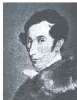
CARL MARIA von WEBER (1786-1826) ΕΙΣΑΓΩΓΗ ΑΠΟ ΤΗΝ ΟΠΕΡΑ "OBERON"

Η υπόθεση της όπερας αυτής του Βέμπερ είναι παρμένη από την ιστορία "Huon de Bordeaux", μια ιστορία πολύπλοκη και παράξενη. Ο Όμπερον, βασιλιάς των νεράιδων, μαλώνει με τη γυναίκα του και ορκίζεται πως δεν θα ξαναφιλήσει μαζί της παρά σαν βρεθεί ένα ζευγάρι τόσο αγαπημένο, που να είναι ακλόνητο στην αγάπη του, παρά τις οποιεσδήποτε δοκιμασίες που μπορεί να υποστεί.