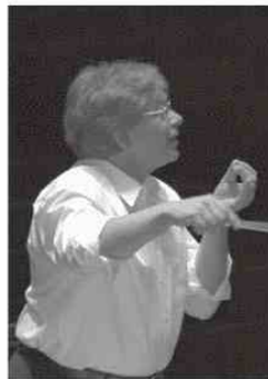
ALEXANDRU LASCAE διευθυντής ορχήστρας

Ο Alexandru Lascae γεννήθηκε το 1942 στο Βουκουρέστι της Ρουμανίας. Σπούδασε βιολιά και μουσική δωματίου στο Ωδείο του Βουκουρεστίου και συνέχισε τις σπουδές του στο Ωδείο των Βρυξελλών, όπου και κέρδισε πολλά βραβεία μουσικής δωματίου. Εργάστηκε στην Ολλανδία το 1969 ως δεύτερος εξάρχων στην Residentie Orchestra της Χάγης και ως πρώτο βιολιά στο Κουαρτέτο Εγχόρδων Residentie. Ταξίδεψε με το Κουαρτέτο Εγχόρδων Residentie σε όλη την Ευρώπη και κέρδισε το πρώτο βραβείο στο διεθνή διαγωνισμό μουσικής στην Κολμάρ της Γαλλίας. Συνέχισε τις σπουδές του στη διεύθυνση ορχήστρας, υπό την καθοδήγηση των Franco Ferrara, Neeme Jarvi, Kiril Kondrashin και David Porcellijn. Το 1980 έκανε το ντεμπούτο του ως διευθυντής