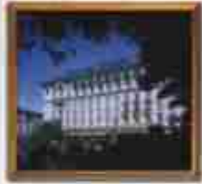
***** Cherry Point ***** SARAJEVO