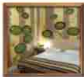
***** Stella Grand ***** SARAJEVO