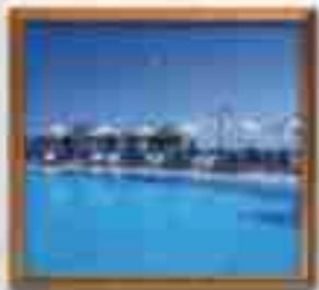
***** Arena Water ***** SARAJEVO