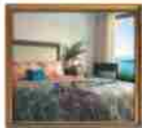
***** Perla Grand Hotel ***** SARAJEVO