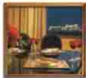
***** Amelia Restaurant *****