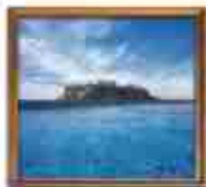
***** High Seas Club *****