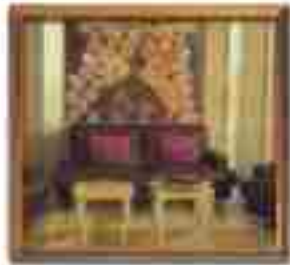
***** Acropolis *****