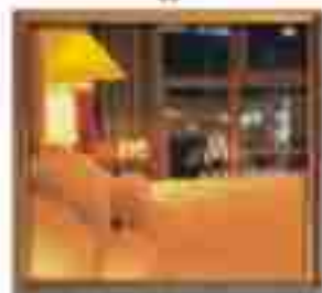
***** Spartan *****