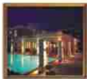
***** Prestige Suite *****