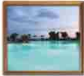
***** Sikania *****