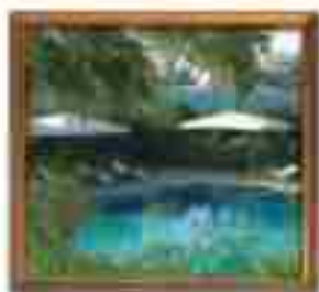
***** Spartan Suite *****