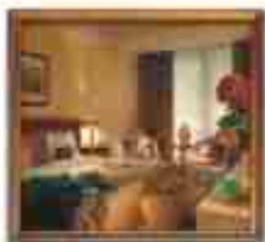
***** Jazz Lounge Club *****