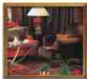
***** Suzette Grand *****