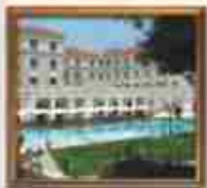
***** Lovers' Paradise *****