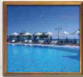
***** ASTIR HOTEL ALEXANDROUPOLI