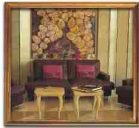
***** ACROPOL ATHENS