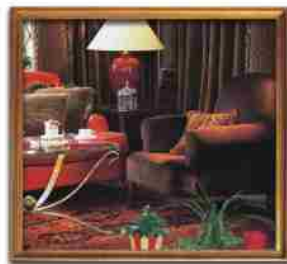
***** EGNATIA GRAND ALEXANDROUPOLI