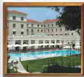
***** LARISSA IMPERIAL LARISSA