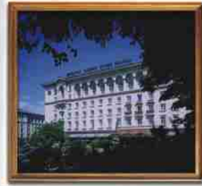
***** SHERATON SOPIA BALKAN HOTEL & CASINO BULGARIA