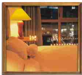
***** Grand O Hotel ATHENS