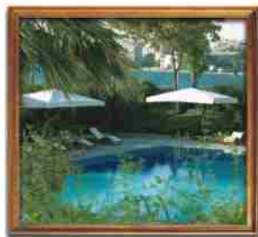
***** HERODIA PALACE THESSALONIKI