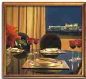
***** ATHENS IMPERIAL ATHENS