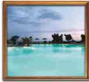
***** Filoxenia KALAMATA