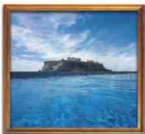
***** King George Palace ATHENS Signature member