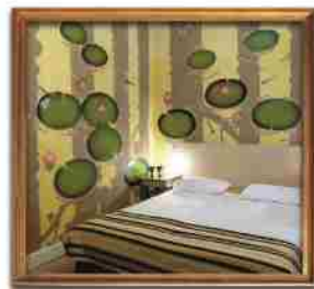
***** Baby Grand ATHENS