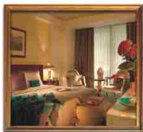
***** NY ATHENS PLAZA ATHENS