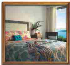
***** VOULAGMENI SUITES ATHENS