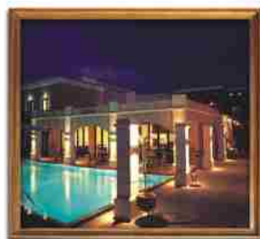
***** PLAZA SPA SUITES ATHYMFNO, GREY