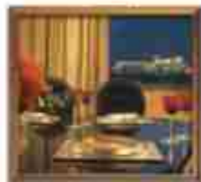
***** Seaside Apartments LIMASSOL