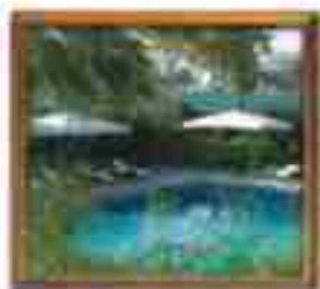
***** Blue Sea LIMASSOL HOTEL