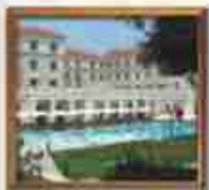
***** Limassol Harbour LIMASSOL