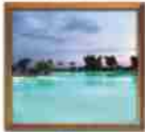
***** Blue Sea LIMASSOL HOTEL