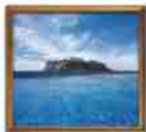
***** Blue Horizon Hotel LIMASSOL