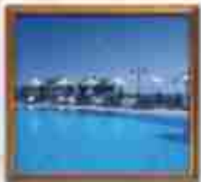
***** Blue Sea LIMASSOL HOTEL