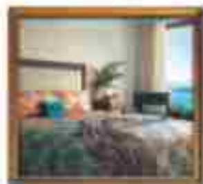
***** Blue Sea LIMASSOL HOTEL