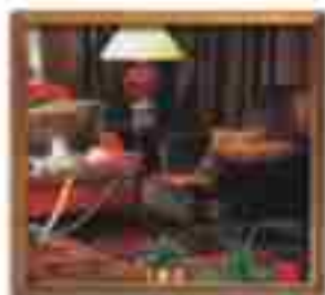
***** Blue Sea Grand LIMASSOL HOTEL