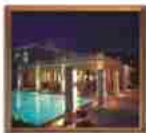
***** Blue Sea Hotel LIMASSOL HOTEL