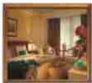
***** ACEF Supreme Hotel LIMASSOL