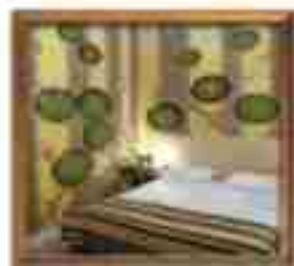
***** Blue Grand LIMASSOL