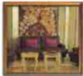
***** ALBAFOL LIMASSOL