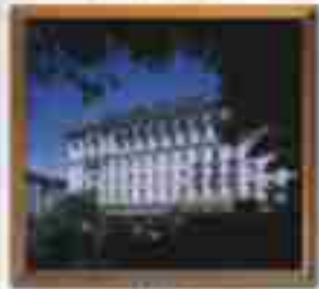
***** Blue Sea LIMASSOL HOTEL