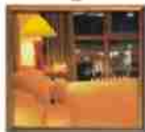
***** Blue Sky LIMASSOL