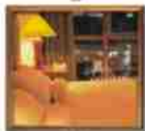
***** Palace Suites LIMASSOL