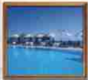
***** Blue Point LIMASSOL