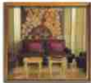
***** Allegro LIMASSOL