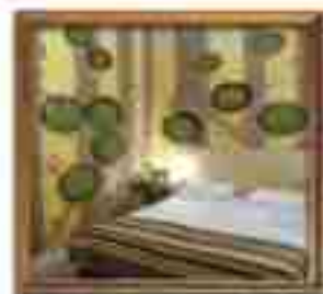
***** Blue Point LIMASSOL