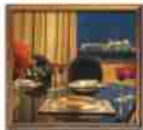
***** Palace Suites LIMASSOL