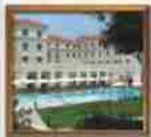
***** Luxury Suites LIMASSOL