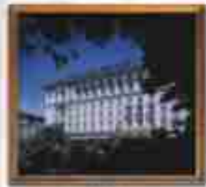
***** Palace Suites LIMASSOL