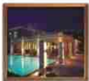
***** Palace des Indes LIMASSOL