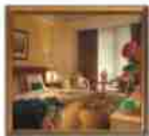
***** JOY'S SUITES ELARA LIMASSOL