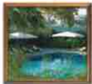
***** Palace Suites LIMASSOL