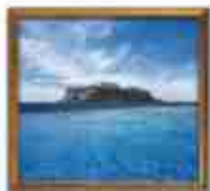
***** Blue Paradise Hotel LIMASSOL