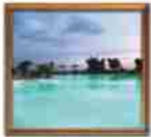
***** Palace Suites LIMASSOL