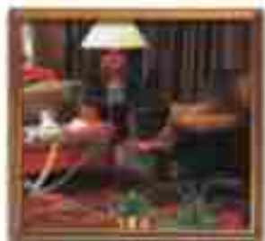
***** Palace Suites LIMASSOL