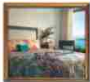
***** Palace Suites LIMASSOL