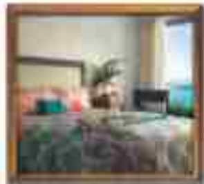
★★★★ Green Valley Cancun Quintana Roo