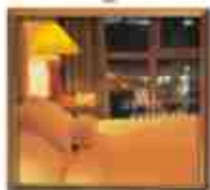
★★★★ Green Valley Cancun Quintana Roo