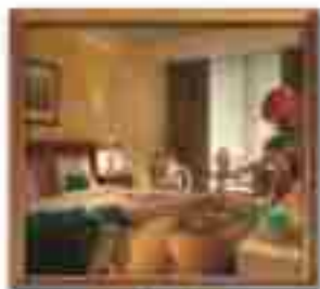
★★★★ 77 Terrace Place Jamaica Jamaica