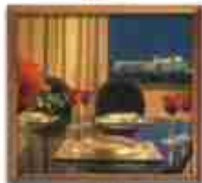
★★★★ Marina Suites Cancun Quintana Roo