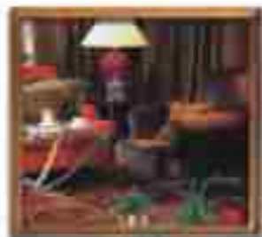
★★★★ Blue Bay St. John's Antigua