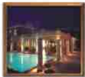
★★★★ Plaza del Sol Cabo San Lucas Baja California Sur