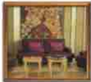
★★★★ Alcornoque Cancun Quintana Roo