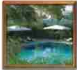
★★★★ Blue Bay St. John's Antigua