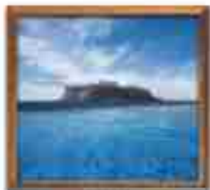
★★★★ Blue Bay Palace St. John's Antigua