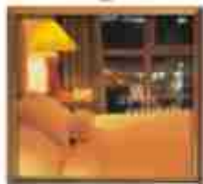
★★★★ Green Valley Cancun Quintana Roo