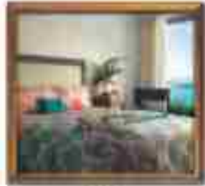
★★★★ Green Valley Cancun Quintana Roo