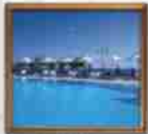
★★★★ Artis Hotel Cancun Quintana Roo