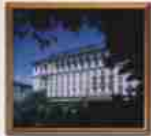
★★★★ Blue Bay Palace St. John's Antigua