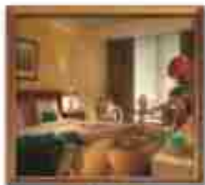
★★★★ 77 Terrace Place Jamaica Jamaica