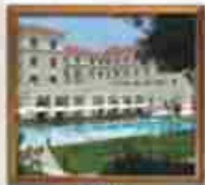
★★★★ Luxury Suites Cancun Quintana Roo