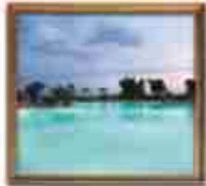
★★★★ Silicon Cancun Quintana Roo