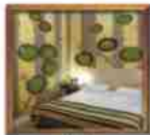
★★★★ Blue Bay St. John's Antigua