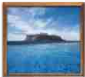
★★★★ Blue Bay Palace St. John's Antigua