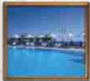
★★★★ Artis Hotel Cancun Quintana Roo