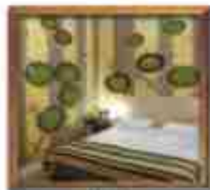
★★★★ Blue Bay St. John's Antigua