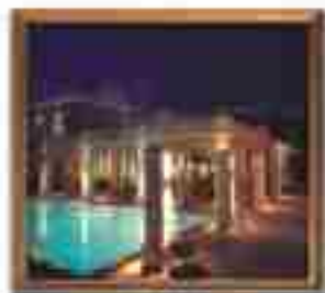
★★★★ Plaza del Sol Cabo San Lucas Baja California Sur