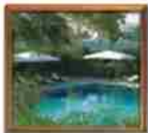
★★★★ Blue Bay St. John's Antigua