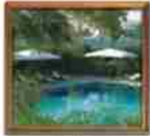
★★★★ Blue Bay St. John's Antigua