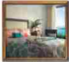
★★★★ Green Valley Cancun Quintana Roo