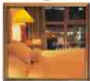
★★★★ Green Valley Cancun Quintana Roo