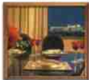
★★★★ Marina Suites Cancun Quintana Roo