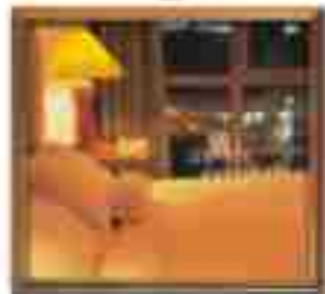
★★★★ Green Valley Nassau Bahamas