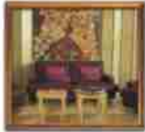
★★★★ Alcornoque Nassau Bahamas