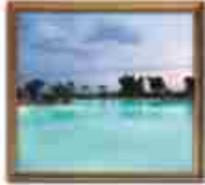
★★★★ Silencio Cabo San Lucas Baja California Sur