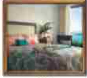
★★★★ Green Valley Nassau Bahamas