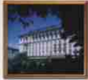
★★★★ Blue Bay Grand Cabo San Lucas Baja California Sur