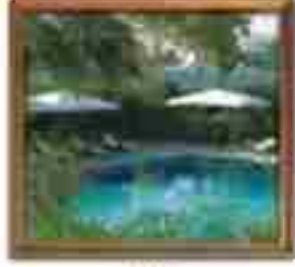
★★★★ Blue Bay Cabo San Lucas Baja California Sur