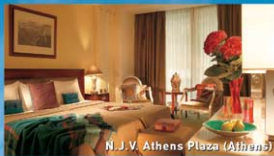
N. J. V. Athens Plaza (Athens)