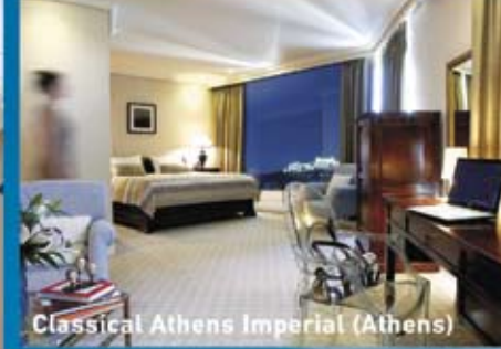
Classical Athens Imperial (Athens)