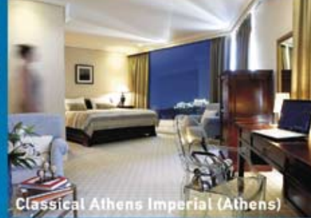
Classical Athens Imperial (Athens)