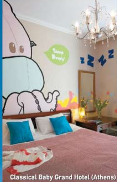
Classical Baby Grand Hotel (Athens)