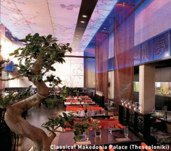
Classical Makedonia Palace (Thessaloniki)