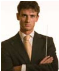
ALEXANDER SHELLEY διευθυντής ορχήστρας

Ο εικοσιεξάχρονος Άγγλος μαέστρος Alexander Shelley καθιερώνεται με γοργούς ρυθμούς ως ένα από τα πιο δημιουργικά μουσικά ταλέντα της γενιάς του.