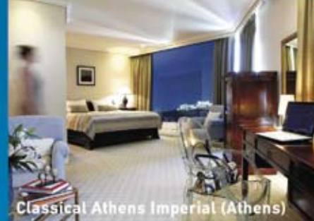
Classical Athens Imperial (Athens)