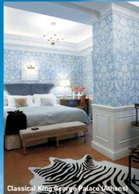
Classical King George Palace (Athens)