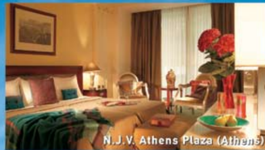
N.J.V. Athens Plaza (Athens)