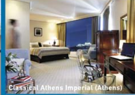
Classical Athens Imperial (Athens)