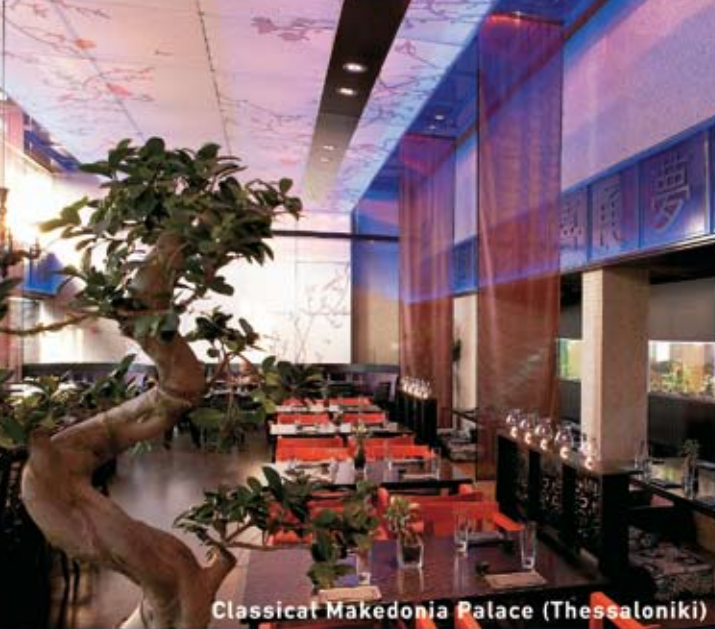
Classical Makedonia Palace (Thessaloniki)