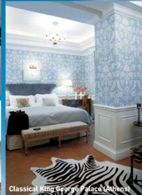
Classical King George Palace (Athens)