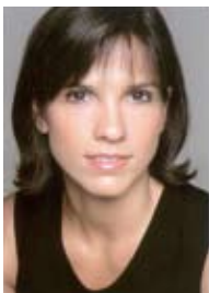
ΜΑΡΙΑ ΑΣΤΕΡΙΑΔΟΥ πιάνο

Η ελληνικής καταγωγής Μαρία Αστεριάδου είναι μια διακεκριμένη σολίστ και μουσικός δωματίου, η οποία έχει καταξιωθεί ως καλλιτέχνης με έντονη προσωπικότητα, γνήσιο ταλέντο και υπέροχο τόνο.