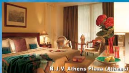
N. J. V. Athens Plaza (Athens)