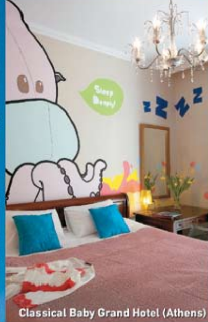
Classical Baby Grand Hotel (Athens)