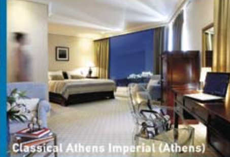
Classical Athens Imperial (Athens)