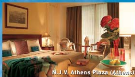
N.J.V. Athens Plaza (Athens)