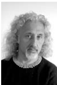
MISCHA MAISKY Βιολοντσέλο

Ο μοναδικός τσελίστας στον κόσμο που έχει μαθητεύσει με τον Μτσιαλάβ Ροστρόπόβιτς και τον Γκρεγκόρ Πιατιγκόρσκι.