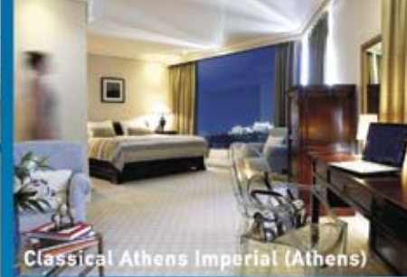
Classical Athens Imperial (Athens)