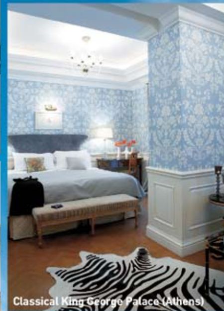
Classical King George Palace (Athens)