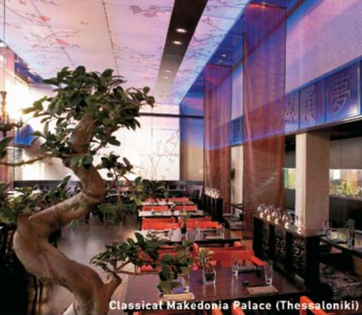
Classical Makedonia Palace (Thessaloniki)