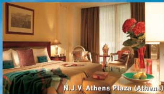
N.J.V. Athens Plaza (Athens)