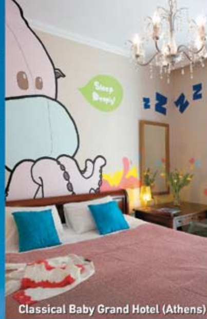
Classical Baby Grand Hotel (Athens)