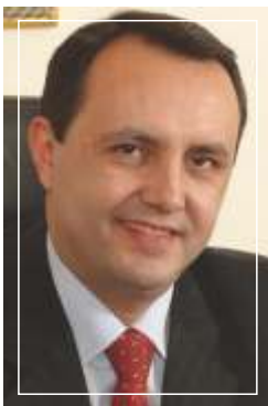
Θεόδωρος Γ. Καράογλου Υπουργός Μακεδονίας και Θράκης